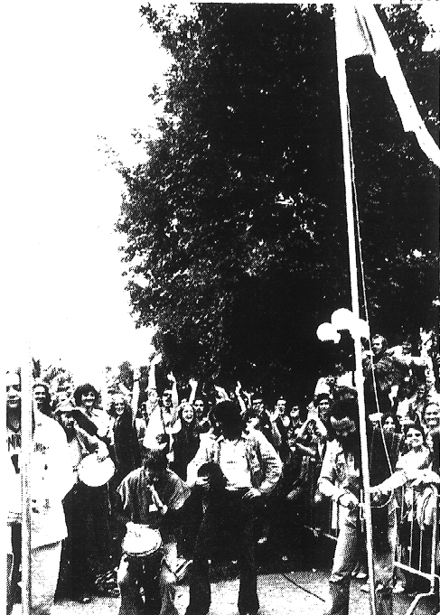
On hisse les drapeaux des pays participants.