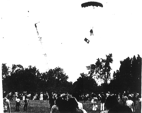
Un participant à la Super-Franco-Fête faisait, hier, une entrée remarquée.