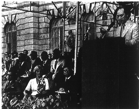
M. Pierre Elliott Trudeau durant l'allocution de bienvenue qu'il prononçait, hier, face à l'Hôtel du gouvernement. L'allocution fut interrompue par des adversaires de la loi 22.

Le chef du gouvernement québécois a subi un pire traitement, tout de suite après. Il a parlé une dizaine de minutes et, dans la foule, on entendait à peine ses paroles.