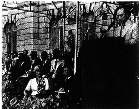
M. Pierre Elliott Trudeau durant l'allocution de bienvenue qu'il prononçait, hier, face à l'Hôtel du gouvernement. L'allocution fut interrompue par des adversaires de la loi 22.

Le chef du gouvernement québécois a subi un pire traitement, tout de suite après. Il a parlé une dizaine de minutes et, dans la foule, on entendait à peine ses paroles.