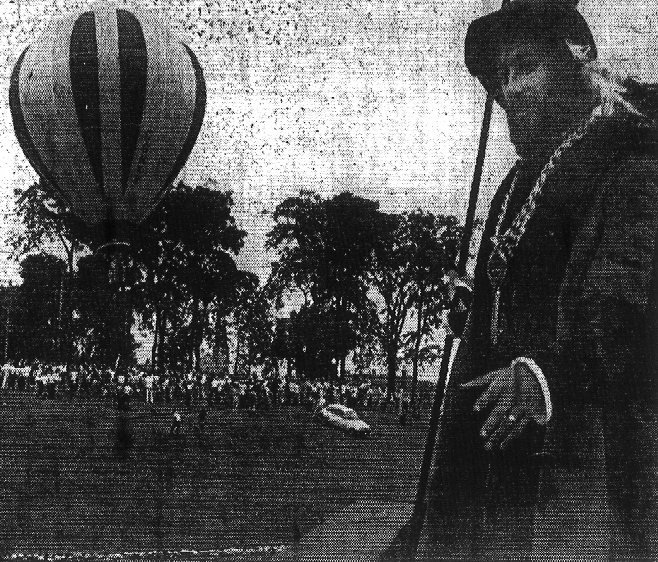
Le Soleil. Gilles Lafond

Plus de 3.000 personnes ont vu les cérémonies du salut au drapeau sur les terrains de la résidence du gouverneur général et un soldat de la Garde a perdu connaissance.