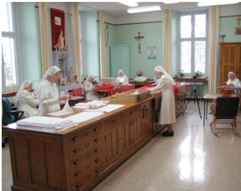
L'atelier d'arts liturgiques chez les Petites Sœurs de la Sainte-Famille, IPIR 2009

Chaire de recherche du Canada en patrimoine ethnologique Université Laval Québec 418-656-2311 (13571)